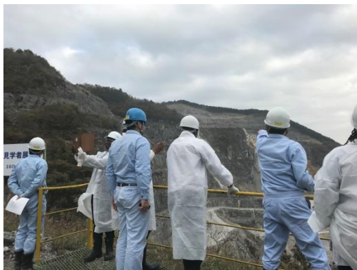
写真1 鉱山の説明を受けている様子①