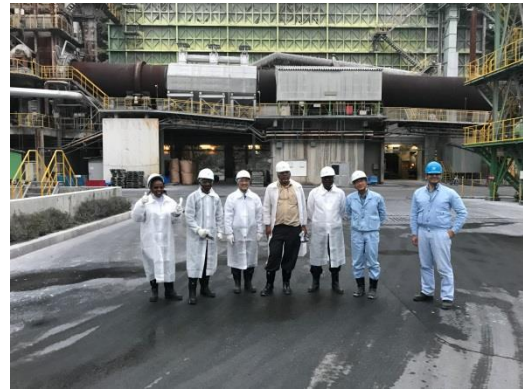
写真6 集合写真（工場）