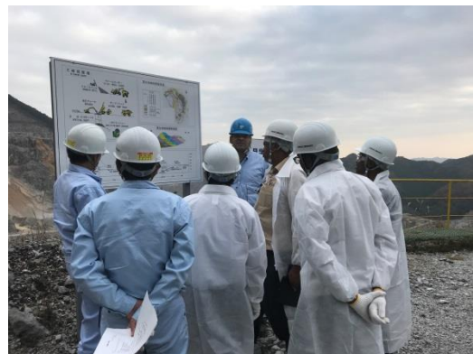
写真2 鉱山の説明を受けている様子②