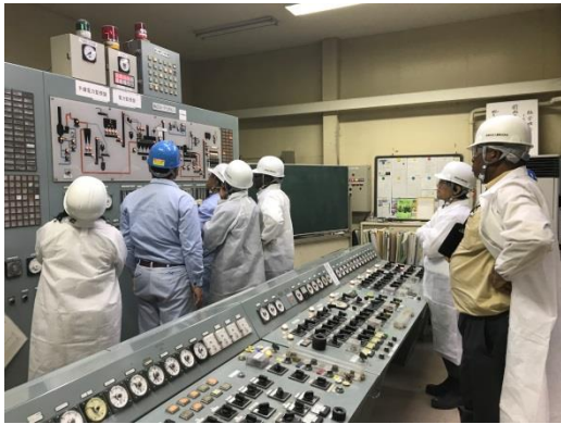
写真5 工場設備の説明を受けている様子