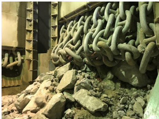
写真3 掘削後のドロマイト