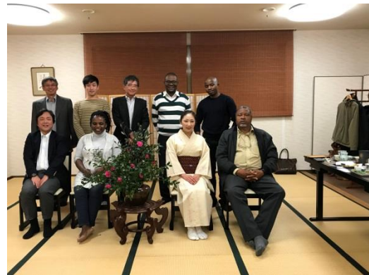
写真8 集合写真（懇親会）