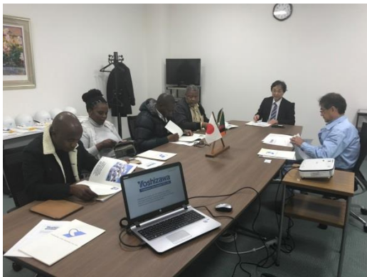
写真7 製品の説明を受けている様子